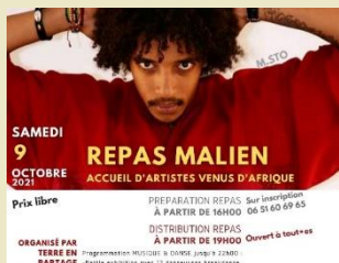
Terre En Partage, 2022