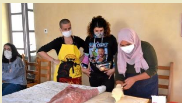
Midi Libre 03/02/2021