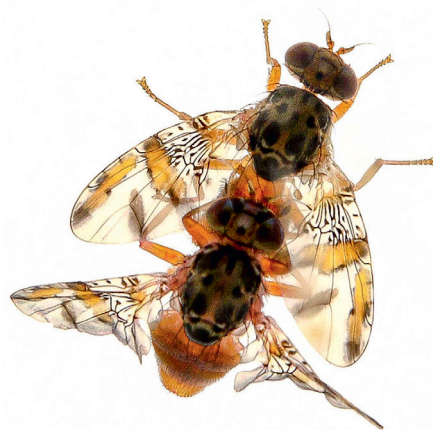
1 - Ceratitits capitata , mouche des fruits, ravageur-cible de développements actuels en technique de l'insecte stérile.

Les stratégies de lutte biologique sont basées sur l'exploitation de relations interspécifiques antagonistes, le macro-organisme