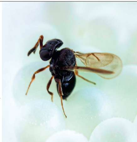
Trissolcus basalis , parasitoïde oophage, lâché en lutte biologique (augmentation) pour la lutte biologique contre des punaises phytophages telles que Halyomorpha halys .

Malgré des historiques, des tenants et des aboutissants qui peuvent varier, les différentes stratégies de biocontrôle à l'aide de macro-organismes (voir article précédent, p. 14-18) partagent un même cadre de réflexion en termes de recherche et développement (R&D) (Figure 1 page suivante). Depuis l'échantillonnage initial sur le terrain de souches d'auxiliaires jusqu'à l'évaluation de leurs impacts au champ, la R&D dans le domaine doit prendre en compte différents enjeux.