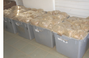
Stockage des carottes en sachet individuel