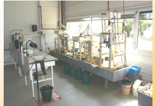
Poste de travail pour l'extraction des racines et des graines du sol avec Racinator I & II.