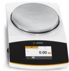
Pesées pour déterminer la « Masse racinaire »