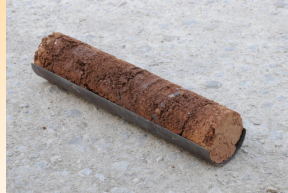
Dimension d'une carotte de terre L = 330 mm - Ø 70 mm Volume = 1.2l