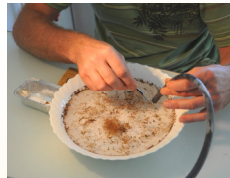
Tri manuel final dans une assiette à l'aide d'une pince et d'une trompe à eau.