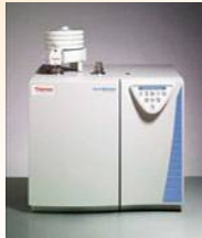
Analyse CPG Teneur C-N