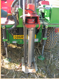
Prélèvements racinaires sur 3 horizons (0 - 30 cm, 30 - 60 cm, 60 - 90 cm) Prélèvements des graines uniquement sur l'horizon de surface