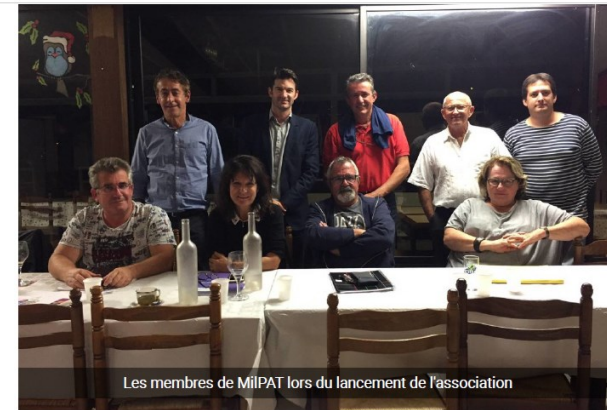
Les membres de MilPAT lors du lancement de l'association

on fonctionnement, ce site utilise les cookies. Plus d'informations