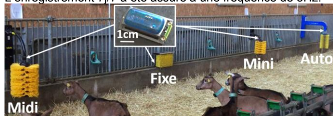
Figure 1. Quatre modèles de brosse et leurs accéléromètres.

Deux parcs de 50 chèvres (INRAE, UE FERLUS) ont été équipés chacun de quatre modèles de brosse du commerce (Figure 1) du 1/03 au 13/08/2021 : une brosse rectangulaire fixe (Fixe), deux brosses pivotantes de taille petite (Mini) et moyenne (Midi) et une brosse automatique, pivotante et rotative (Auto). Sur chaque brosse, un accéléromètre 3-axes MSR145B7A a été fixé près de la zone de grattage pour détecter les vibrations au contact de l'animal. L'enregistrement 7j/7 a été assuré à une fréquence de 5Hz.