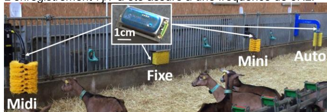
Figure 1. Quatre modèles de brosse et leurs accéléromètres.

Deux parcs de 50 chèvres (INRAE, UE FERLUS) ont été équipés chacun de quatre modèles de brosse du commerce (Figure 1) du 1/03 au 13/08/2021 : une brosse rectangulaire fixe (Fixe), deux brosses pivotantes de taille petite (Mini) et moyenne (Midi) et une brosse automatique, pivotante et rotative (Auto). Sur chaque brosse, un accéléromètre 3-axes MSR145B7A a été fixé près de la zone de grattage pour détecter les vibrations au contact de l'animal. L'enregistrement 7j/7 a été assuré à une fréquence de 5Hz.