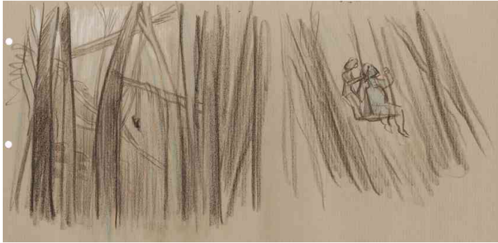
Figure 6 : D'arbre en arbre © Jean-François Laguionie