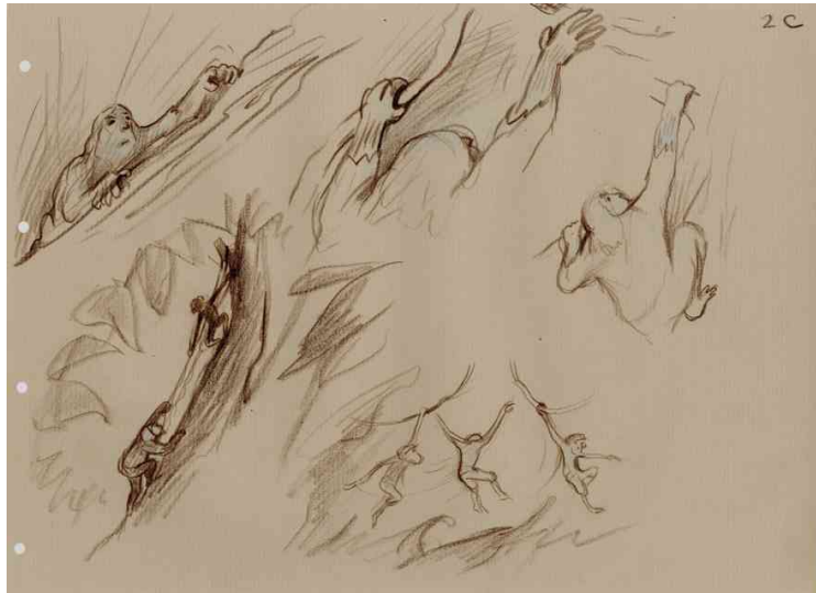
Figure 7 : Circuler © Jean-François Laguionie

« Ces découpes de branches et de feuilles, ces bifurcations, ces lobes, ces touffes, feuillus menu et innombrable ; ce ciel dont on ne voyait que des éclaboussures ou des pans irréguliers ; tout cela existait peut-être seulement pour que mon frère y circulât de son léger pas d'écureuil. C'était une broderie faite sur du néant, comme ce filet d'encre que je viens de laisser couler, page après page. » (Calvino, 1957)