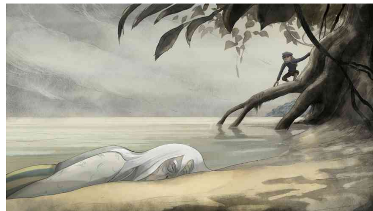
Figure 2 : Le prince échoué © Jean-François Laguionie

L'armée des laankos se dirige sur le lac glacé en direction de l'autre rive qui leur est inconnue ; la glace cède. Kom retourne vers la canopée avec Gina (Laguionie, 1999).