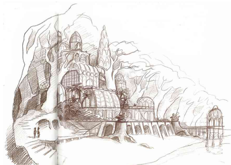
Figure 12 : Jean-François Laguionie (Salachas, 1992) © Atelier Akimbo

les transactions. Le détachement et la fracturation induits installent les éléments dans des hiérarchies, en dehors d'une continuité pourtant à l'œuvre.