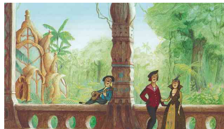
Figure 11 : Jean-François Laguionie (Salachas, 1992)

La notion de transaction enrichit la vision que nous pouvons avoir des relations entre organismes vivants, et de celles qu'ils entretiennent avec l'environnement – dont ils font partie et qu'ils construisent. Inspirés par trois narrations remarquables, un récit littéraire et deux récits cinématographiques, nous avons exploré les transactions dans leurs multiples dimensions.