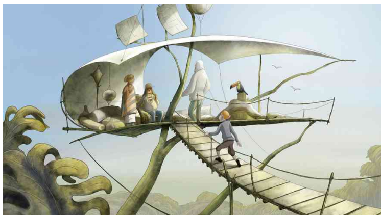
Figure 4 : La canopée © Jean-François Laguionie

Métaphore végétale, les décors sont ici plantés . À travers ce dernier film «Le voyage du Prince », le film précédent qui lui est lié, « Le château des singes » et le