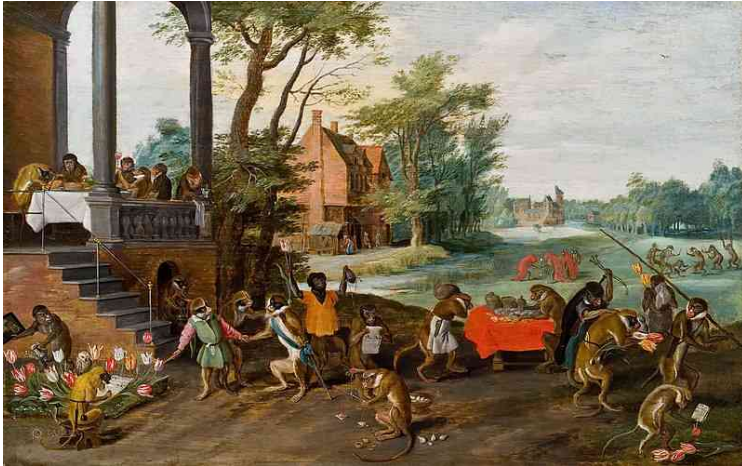
Figure 5 : Allégorie de la tulipomania, Jan Brueghel le Jeune, env. 1640

Notre suggestion est que ce terme, repris et enrichi par des approches philosophiques, pourrait nous permettre de rendre compte, avec la profondeur nécessaire, et dans un cadre évolutif, des liens que les organismes vivants entretiennent les uns avec les autres, ainsi que de leurs relations avec l'environnement, qu'ils créent et dont ils sont partie prenante.