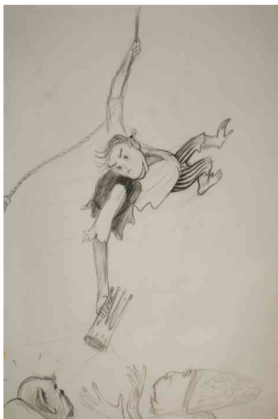
Figure 1 : Un sauvage à éduquer © Jean-François Laguionie

Une communauté de singes est séparée en deux par un tsunami. Les laankos restent au sol, les woonkos dans la canopée : ils s'oublient mutuellement. Un jeune woonko, Kom, brave l'interdit du monde d'en bas, tombe, sa chute est amortie par des fougères. Le prince des laankos le sauve des intentions meurtrières de ses compagnons de chasse. Chez les laankos, il devient un sauvage à éduquer (Fig. 1).