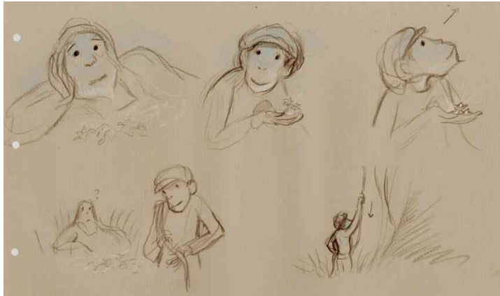
Figure 10 : Fleurs et pétales du berceau © Jean-François Laguionie

Tom : « L'année dernière [...] j'ai retrouvé mon berceau de [...] bébé, dans le fond il y avait des pétales séchés, ce sont les mêmes, j'en suis sûr, c'est dans cet endroit qu'Élisabeth m'a trouvé ! » (Fig. 10)