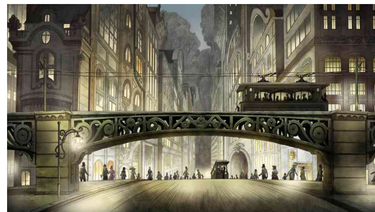
Figure 3 : Nioutone © Jean-François Laguionie

Le prince des lankos est échoué sur un rivage (Fig. 2), sur l'autre rive du lac, en face de son pays, suite à la rupture des glaces. Il est recueilli par des nioukos, singes de la ville, scientifiques. Tom, leur fils adoptif, comprend sa langue et s'occupe de lui. Il lui fait visiter Nioutone (Fig. 3), faite d'immeubles, de tramways et d'ouvriers à la chaîne.