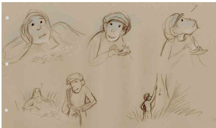
Figure 10 : Fleurs et pétales du berceau

Tom : « L'année dernière [...] j'ai retrouvé mon berceau de [...] bébé, dans le fond il y avait des pétales séchés, ce sont les mêmes, j'en suis sûr, c'est dans cet endroit qu'Élisabeth m'a trouvé ! » (Fig. 10)