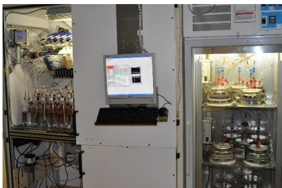
Figure 1 : Dispositif de mesure des potentiels de volatilisation d'ammoniacal de l'UMR EcoSys