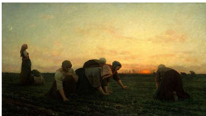
Figure 1 : les désherbeurs, 1868. Jules Breton

Le contrôle des mauvaises herbes a toujours constitué une part importante du travail dans les champs. Le désherbage réalisé dans les parcelles avait pour objectif de favoriser le développement de la culture et de limiter la production de semences adventices qui pouvaient compromettre la qualité de la récolte et être l'origine de futures fortes densités de ces plantes. L'activité de désherbage a été réalisée pendant des millénaires manuellement ( Figure 1 ), puis à l'aide d'outils tractés tout d'abord par des animaux puis par des tracteurs à la suite de la première guerre mondiale.