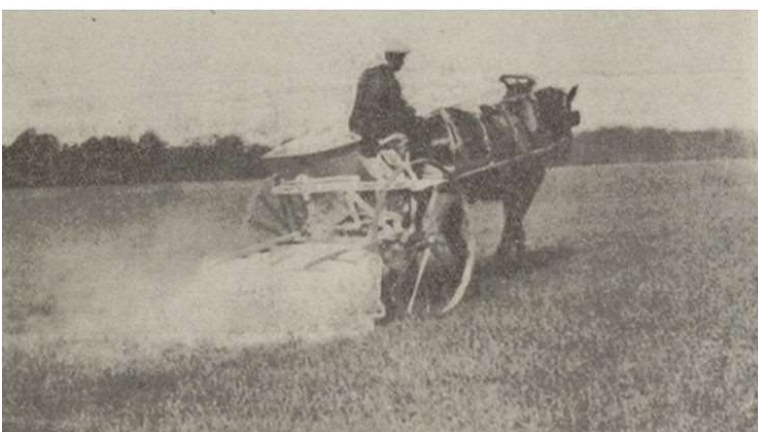
Figure 2 : Journal d'agriculture pratique (1930 – désherbage au sel marin)

Comme pour les maladies fongiques et les ravageurs, agronomes et agriculteurs ont tout d'abord testé un ensemble de substances minérales allant du fer au zinc jusqu'au mercure. Le sulfate de cuivre est la première molécule (1896) pour laquelle des tests d'efficacité ont été réalisés afin d'optimiser la dose en fonction des espèces visées et du stade de développement des plantes. Cependant le coût de cette méthode s'est révélé un obstacle à son développement. Dans le premier quart du XXe siècle, l'acide sulfurique et le sel marin ont été utilisés à plus grande échelle pour contrôler des fortes densités de dicotylédones telles que la moutarde des champs ( Sinapis arvensis ), une mauvaise herbe redoutée à l'époque. Dans le cas du sel marin (Figure 2), plus de 500 kg de sel par hectare semblaient permettre un contrôle acceptable d'un certain nombre d'espèces annuelles mais aussi d'espèces vivaces comme le liseron. L'acide sulfurique a été appliqué dans les années 1910 (méthode Rabaté). Utilisé en France jusque dans les années 1950, cette substance active a été testée dans le monde entier pour améliorer son utilisation et mieux définir son spectre d'action.