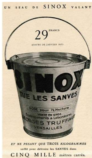
Figure 3 : publicité (~ 1937) pour l'utilisation du produit Sinox© mettant en avant la facilité de manipulation et la surface à traiter. Le DNOC (famille des dinitrophénols) qui constitue la substance active de ce produit commercial issue de la chimie française, a été utilisée de 1933 à 1997 en particulier dans les céréales.

Le produit commercial Sinox© (DNOC - 4,6-dinitro-ortho-cresol ; Figure 3 ) a été le premier herbicide d'origine organique. Développé en France en 1933, ce produit a fait l'objet d'une véritable campagne publicitaire et était conditionné pour traiter un demi-hectare pour en faciliter l'utilisation. Le succès de ce produit pour le contrôle des mauvaises herbes (dont la moutarde des champs (sanve)) dans les cultures de céréales est tel que la société Truffaut met en garde contre son utilisation excessive en particulier dans d'autres cultures.