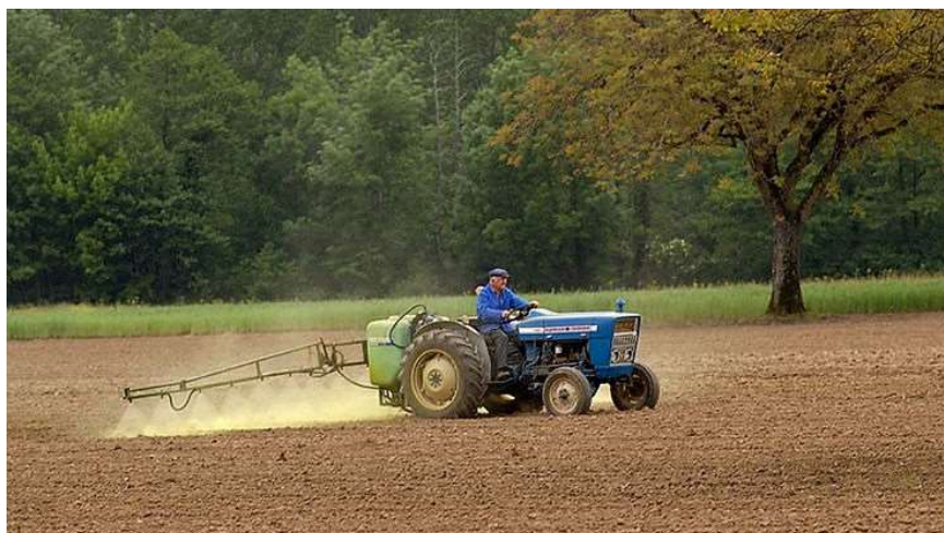
Figure 4 : désherbage à l'aide d'une substance active herbicide (certainement un colorant nitré) avec un matériel datant des années 1970. La protection des utilisateurs a mis du temps à se mettre en place

L'utilisation généralisée des produits de synthèse débute véritablement juste après la seconde guerre mondiale avec la mise sur le marché de produits d'origine anglo-saxonne qui vont s'imposer pour très longtemps. La mise sur le marché de ces molécules n'est pas simple à tracer car c'est seulement à partir de 1961 que l'Association de coordination technique agricole (ACTA) publie régulièrement un index phytosanitaire dans lequel figurent toutes les substances actives à activité phytosanitaire autorisées en France ( Figure 4 ).