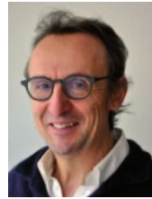
Laurent Terrasson Directeur de publication

Les températures baissent et le reste augmente : denrées alimentaires, énergie, transports, ruptures d'approvisionnement, manque de personnel et recherche de compétences dans un secteur qui voit se développer les contraintes et auquel on demande, enfin, plus de qualité et de durabilité, comme si toutes ces contraintes et ces exigences étaient neutres sur le plan économique.