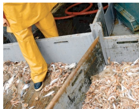
Rejets chalut sélectif / chalut classique