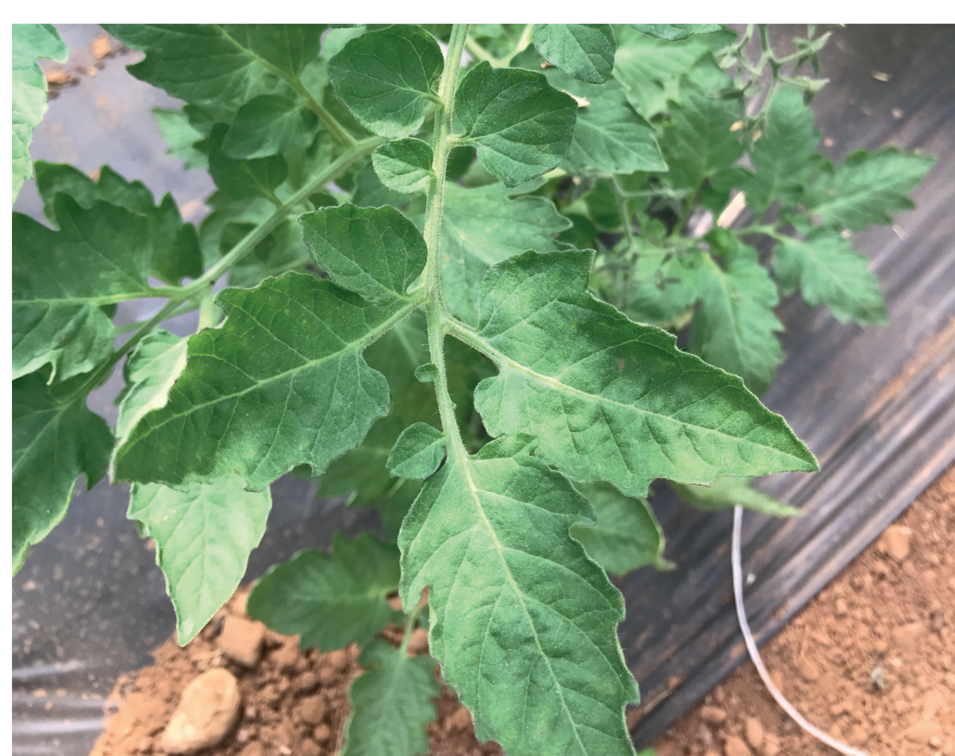
Génotypes de tomate sensibles et résistants à l'oïdium