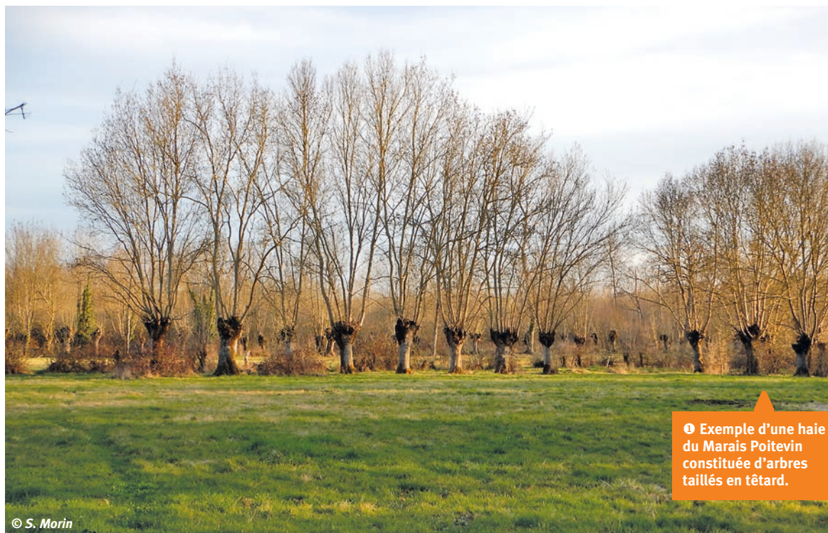
❶ Exemple d'une haie du Marais Poitevin constituée d'arbres taillés en têtard.