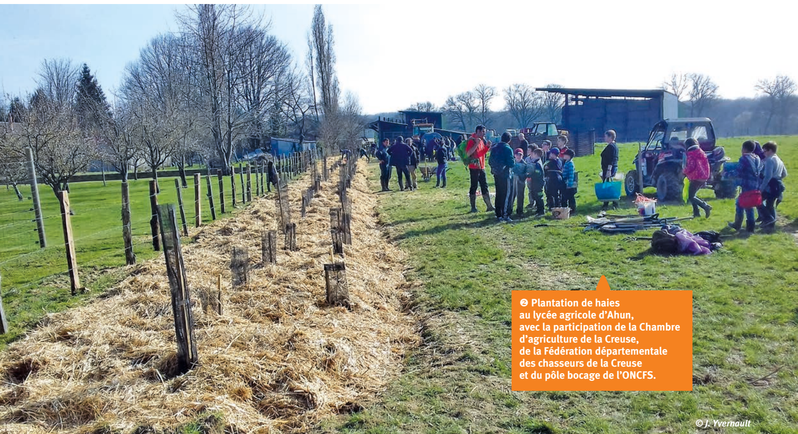
📍 Plantation de haies au lycée agricole d'Ahun, avec la participation de la Chambre d'agriculture de la Creuse, de la Fédération départementale des chasseurs de la Creuse et du pôle bocage de l'ONCFS.