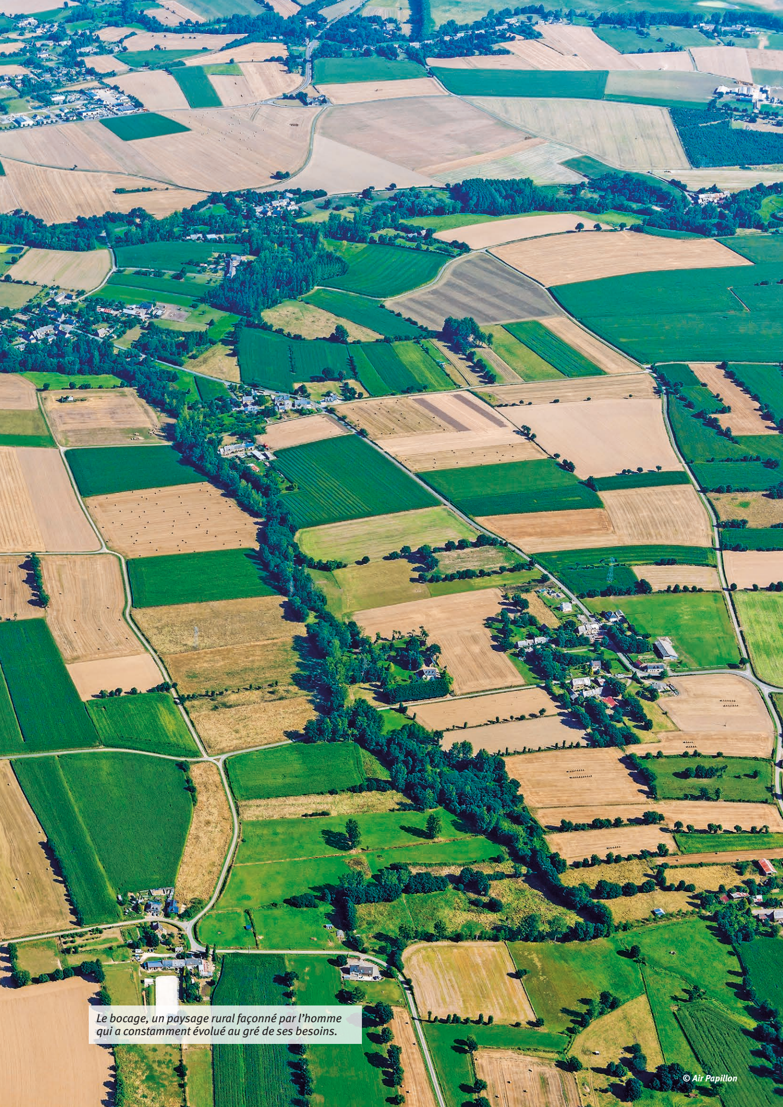
Le bocage, un paysage rural façonné par l'homme qui a constamment évolué au gré de ses besoins.