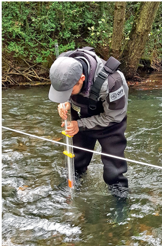
Photo 1 – Déploiement d'une perche à charge dynamique sur le Durzon à Nant (Aveyron) lors d'une formation à la mesure du débit minimum biologique.

sur la verticale, V (en m/s). On calcule ensuite la vitesse moyenne sur la verticale à partir de \Delta h à l'aide d'une formule semi-empirique établie par Pike et al. (2016).