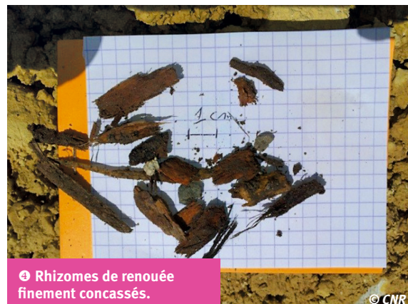
4 Rhizomes de renouée finement concassés.

La maille du trommel doit être adaptée à la densité de rhizomes dans les déblais à traiter. Si la quantité de rhizomes est importante, il peut en effet rester dans le criblât une quantité de rhizomes rendant difficile ou impossible la gestion ultérieure des repousses par des opérations manuelles de contrôle des surfaces. Dans l'essai sur l'Isère avec le SISARC, la quantité de rhizomes restant dans le criblât à 0-20 mm a par exemple été jugée trop importante et un criblage à 0-10 mm a été effectué.