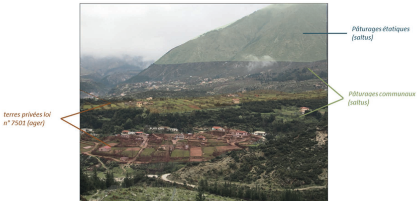
Figure 4. Représentation schématique de la localisation des trois régimes de propriété des terres à Dukat en 2016.