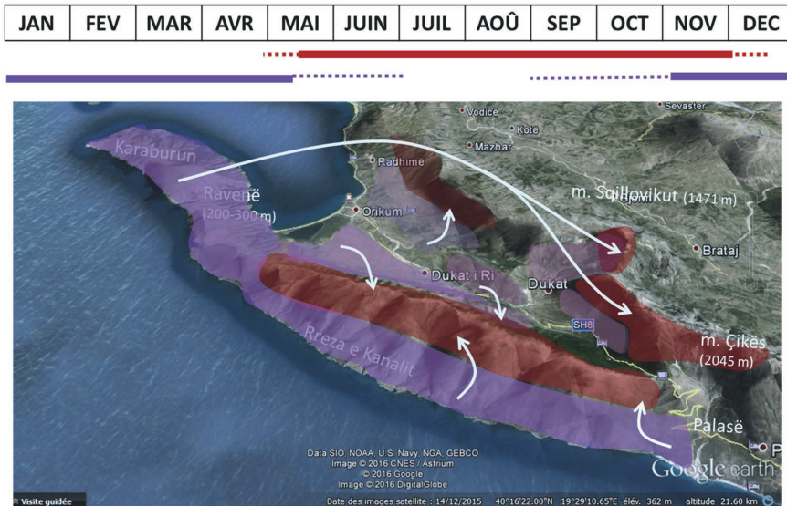
Figure 5. Zones de pâture hivernale et estivale des troupeaux de Dukat.

Sur la période estivale, les troupeaux transhumants montent en altitude pour profiter d'une végétation herbacée plus abondante (fig. 5). L'hiver, ils sont menés sur la péninsule de Karaburun et la face maritime de Rreza e Kanalit, où il neige rarement l'hiver et où des ressources fourragères arbustives sont disponibles. Quelques troupeaux caprins d'autres régions comme Tepelenë, Përmet, ou la vallée voisine Lumi i Vlorës, font une transhumance inverse et viennent sur la péninsule de Karaburun pour la saison d'hiver.