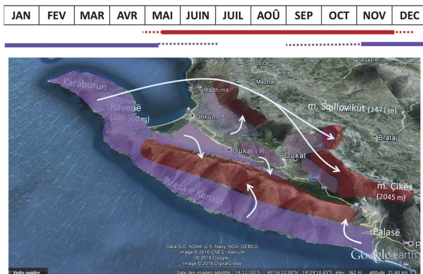
Figure 5. Zones de pâture hivernale et estivale des troupeaux de Dukat.

Sur la période estivale, les troupeaux transhumants montent en altitude pour profiter d'une végétation herbacée plus abondante (fig. 5). L'hiver, ils sont menés sur la péninsule de Karaburun et la face maritime de Rreza e Kanalit, où il neige rarement l'hiver et où des ressources fourragères arbustives sont disponibles. Quelques troupeaux caprins d'autres régions comme Tepelenë, Përmet, ou la vallée voisine Lumi i Vlorës, font une transhumance inverse et viennent sur la péninsule de Karaburun pour la saison d'hiver.