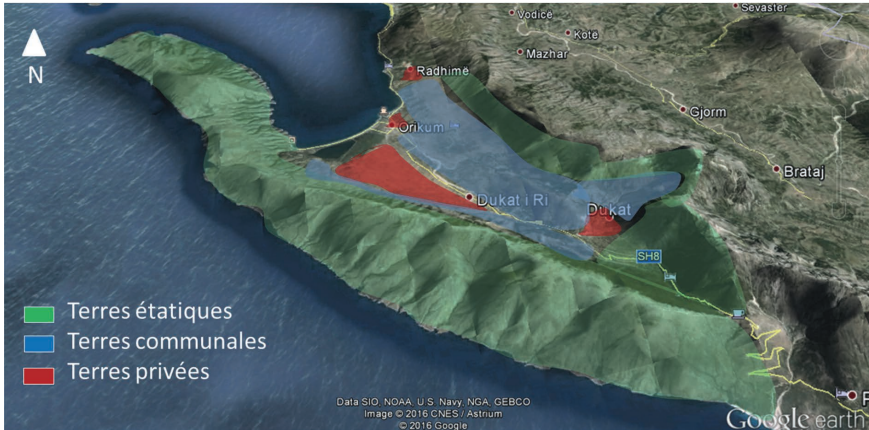
Figure 3. Découpage du paysage agro-sylvo-pastoral du village de Dukat Fshat. D'après une photographie d'A. Garnier (2016).

pâture des animaux d'élevage 33 . Pour le reste des terres communales, des droits de pâture saisonniers sont octroyés par l'unité Administrative d'Orikum, puis par la municipalité de Vlora depuis la réforme territoriale.