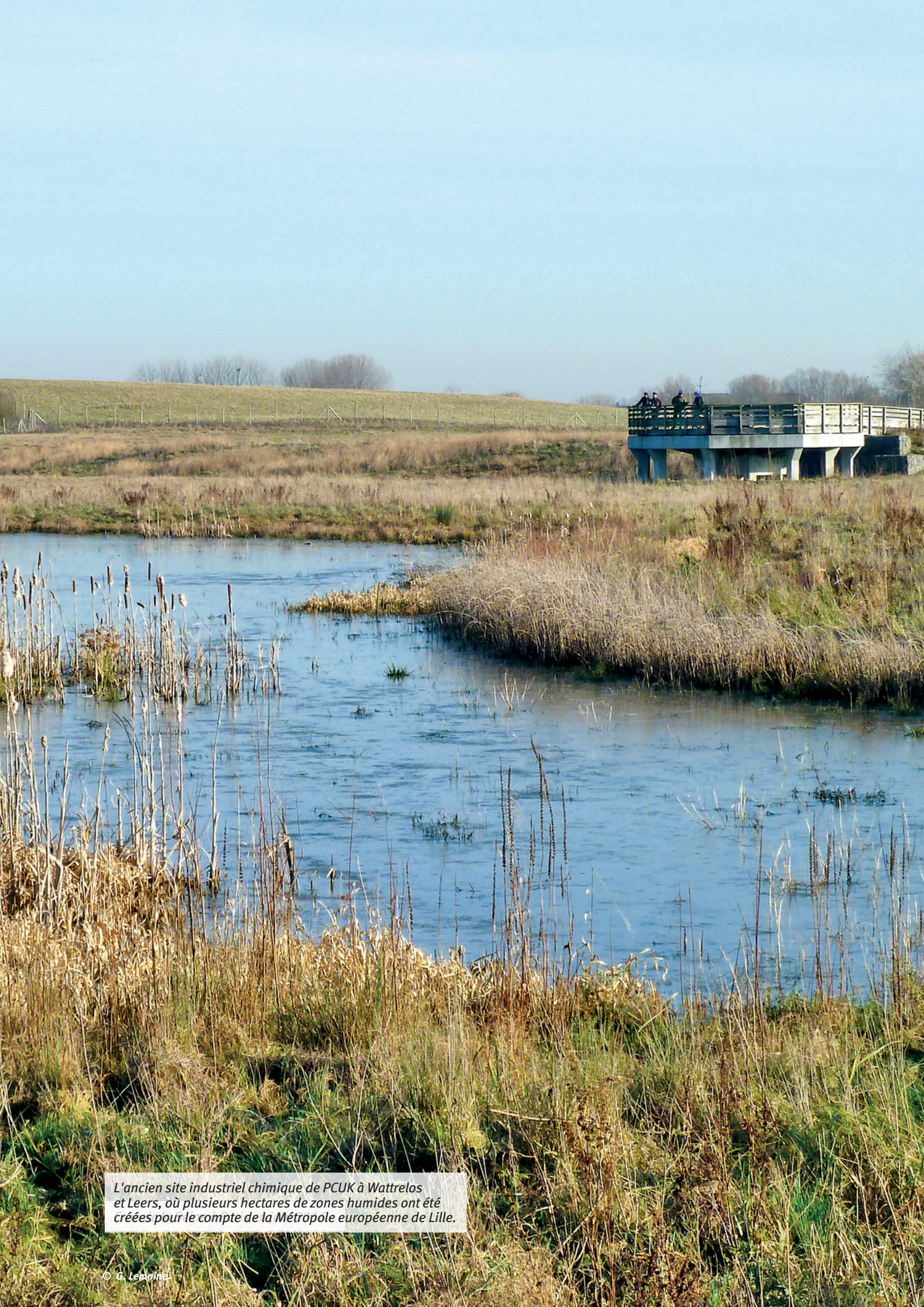
L'ancien site industriel chimique de PCUK à Wattrelos et Leers, où plusieurs hectares de zones humides ont été créées pour le compte de la Métropole européenne de Lille.