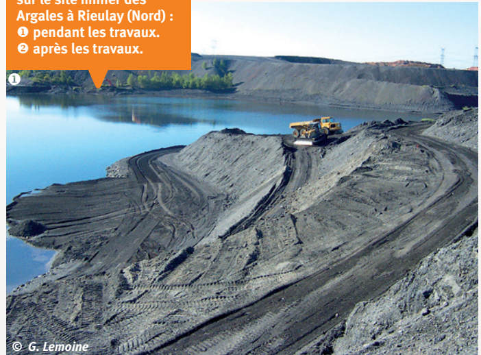
Travaux de renaturation sur le site minier des Argales à Rieulay (Nord) : ① pendant les travaux. ② après les travaux.

L'EPF restaure également des gravières et carrières de craie en maîtrise d'ouvrage, ou accompagne divers partenaires privés dans des actions similaires (création de dépressions humides, de mares et restauration de berges d'étang...), notamment avec les entreprises de carrière comme le montrent les actions réalisées sur le site de la sablière de Hamel (création de mares et d'une petite lande à éricacées en plus des talus de sables et de limons conservés et/ou recréés pour les Hyménoptères sabulicoles), ou celles réalisées sur l'ancienne sablière de Bourbourg (création de vasières et d'une dépression humides sur sable ; milieu assez proche d'une « panne » dunaire).