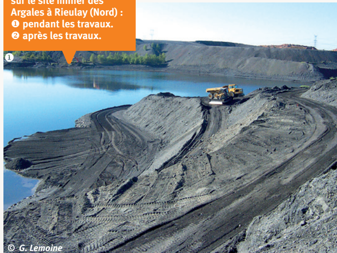
Travaux de renaturation sur le site minier des Argales à Rieulay (Nord) : ① pendant les travaux. ② après les travaux.

L'EPF restaure également des gravières et carrières de craie en maîtrise d'ouvrage, ou accompagne divers partenaires privés dans des actions similaires (création de dépressions humides, de mares et restauration de berges d'étang...), notamment avec les entreprises de carrière comme le montrent les actions réalisées sur le site de la sablière de Hamel (création de mares et d'une petite lande à éricacées en plus des talus de sables et de limons conservés et/ou recréés pour les Hyménoptères sabulicoles), ou celles réalisées sur l'ancienne sablière de Bourbourg (création de vasières et d'une dépression humides sur sable ; milieu assez proche d'une « panne » dunaire).