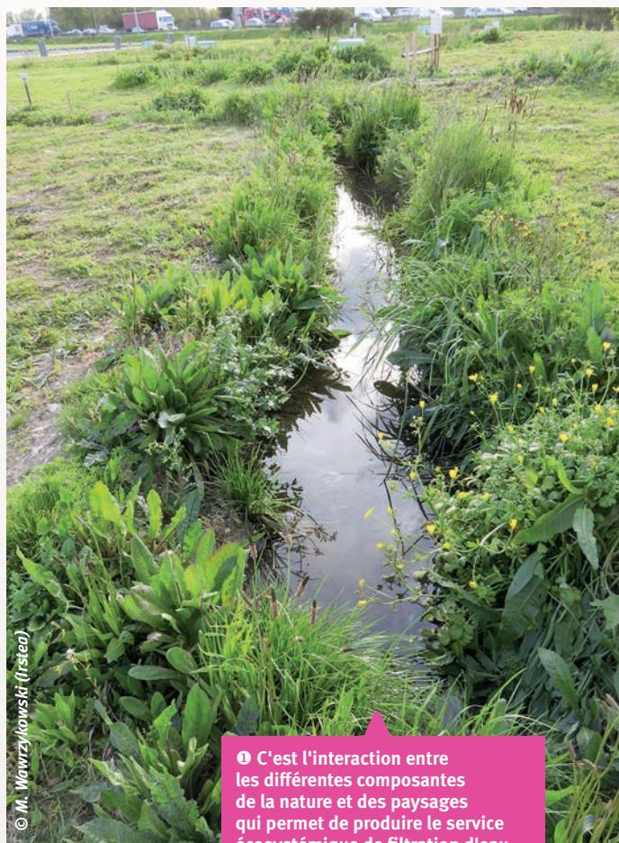
1 C'est l'interaction entre les différentes composantes de la nature et des paysages qui permet de produire le service écosystémique de filtration d'eau.

La méthode pour évaluer les services écosystémiques consiste à mobiliser les modèles présents dans le logiciel InVEST. Chacun des modèles correspond à un service écosystémique. Pour alimenter le modèle, il faut réunir des couches d'information spatiale de différentes natures. À titre d'exemple, pour le service écosystémique de filtration des eaux (nitrate et phosphate), il est nécessaire de disposer des couches suivantes : apport d'eau, occupation et usage du sol, précipitation, profondeur du sol, évapotranspiration, fraction d'eau utilisable par les plantes, limite des bassins versant, modèle numérique de terrain. C'est la superposition de ces différentes couches qui permet de décrire spatialement les services écosystémiques. En effet, c'est l'interaction entre ces différentes composantes de la nature et des paysages qui permet de produire le service écosystémique de filtration d'eau (photo 1). Le calibrage est validé par des publications auxquelles le logiciel InVEST donne accès, permettant une grande transparence dans le paramétrage de l'outil. Ce travail de collecte de données spatiales a été réalisé pour les services écosystémiques suivants : stockage de carbone, production agricole, atténuation de l'érosion, atténuation des inondations, accès aux espaces verts pour les riverains, ainsi que pour la biodiversité patrimoniale considérée pour sa valeur culturelle.