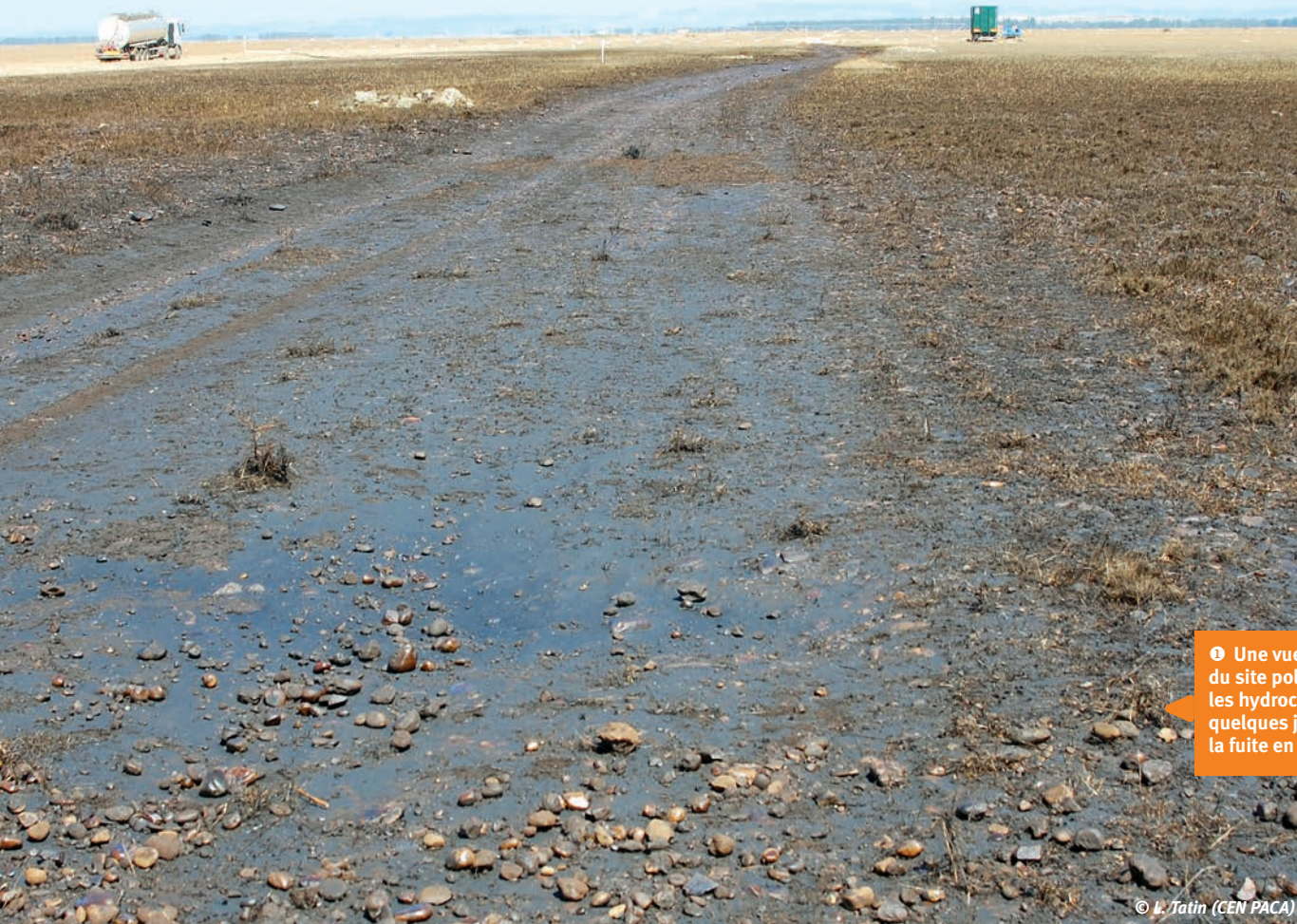
① Une vue partielle du site pollué par les hydrocarbures quelques jours après la fuite en août 2009.