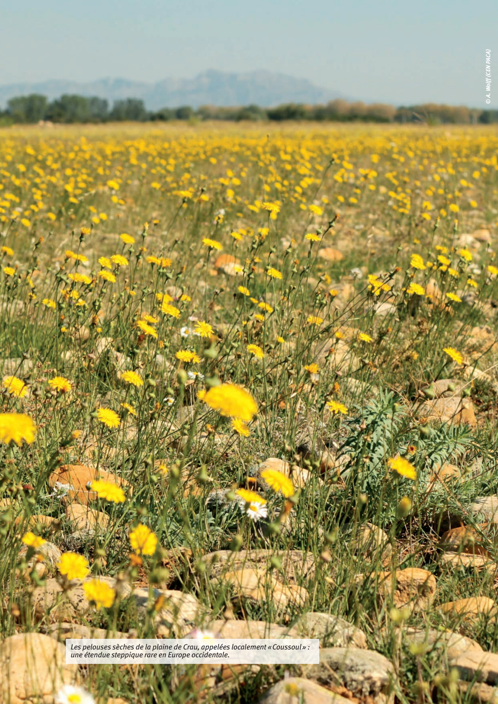
Les pelouses sèches de la plaine de Crau, appelées localement « Cousoul » : une étendue steppique rare en Europe occidentale.