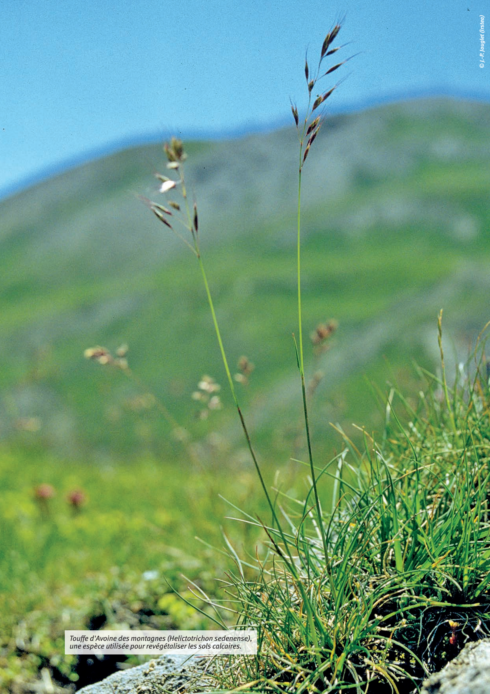
Touffe d'Avoine des montagnes ( Helictotrichon sedenense ), une espèce utilisée pour revégétaliser les sols calcaires.