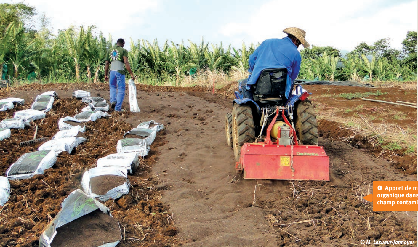
➊ Apport de matière organique dans un champ contaminé.