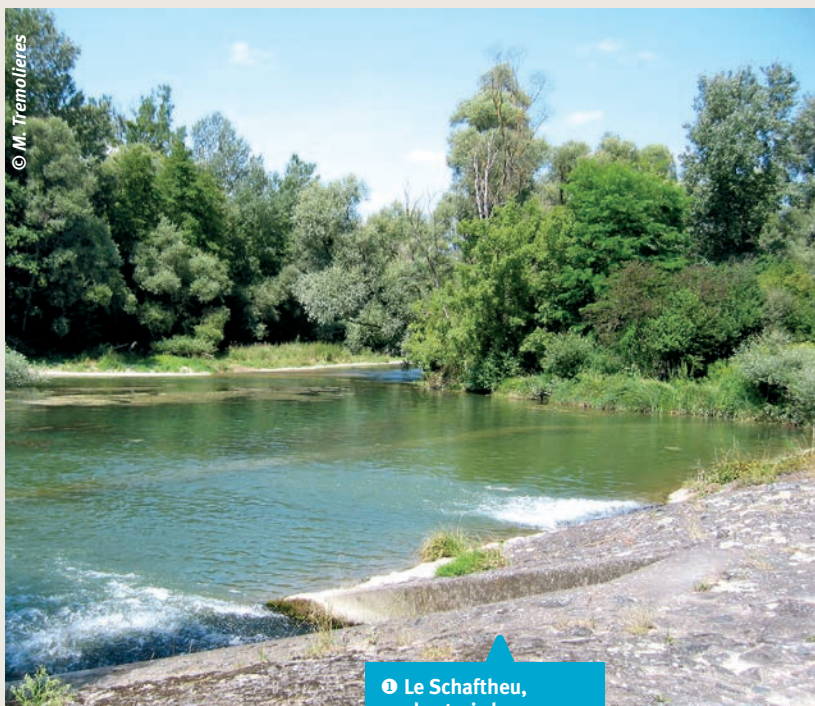
1 Le Schaftheu, un des trois bras de référence, situé sur l'île de Rhinau.

Nous avons aussi étudié les flux de diaspores (graines, rhizomes, fragments, bulbes, bourgeons, turions, etc.) dans les bras, flux pouvant ainsi participer à la recolonisation. Les stratégies de recolonisation ont été analysées au travers de treize traits biologiques : quatre traits morphologiques, comme la taille potentielle, la forme de croissance (non ancrée, ancrée avec feuilles flottantes, ancrée avec tissus de soutien...), cinq traits écologiques comme la tolérance aux variations d'humidité (résistance à l'exondation) ou le niveau trophique des espèces, et quatre traits liés à la reproduction et à la dispersion. L'évolution temporelle de ces traits dans les communautés de macrophytes a été suivie en couplant tableau de traits par espèce et composition floristique des communautés.