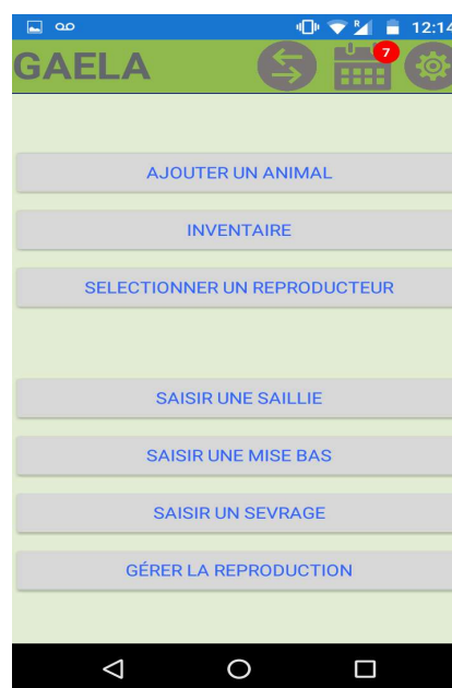
Figure 1: GAELA - Menu "accueil"

La première version de GAELA pour smartphone (sous Android) a été réalisée en 2018 (Figure 1). Elle permet la saisie directe "au champ" et unique, des informations concernant les reproducteurs (mâles ou femelles), la saillie, la parturition et le sevrage. GAELA génère des notifications en lien avec calendrier de travail (Figure 2).