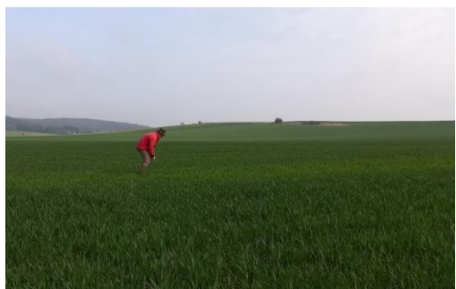
Photo 3 : Un des participants en train de mesurer l'INN du témoin non fertilisé

Les participants ont notamment repéré le témoin non fertilisé : sa couleur plus pâle que le reste de la parcelle marque une moindre richesse en azote de la culture de blé. L'un des participants était venu avec la pince N-tester et a fait état de ses mesures d'indice de nutrition azotée (INN) (Ravier, 2017) qu'il venait de réaliser sur le témoin non fertilisé (Photo 3). Ces mesures indiquaient que le blé non fertilisé, au 31 mars, n'était pas carencé en azote au point d'avoir un rendement pénalisé. L'agriculteur qui cultive ce champ avait lui aussi réalisé des mesures d'INN depuis février.