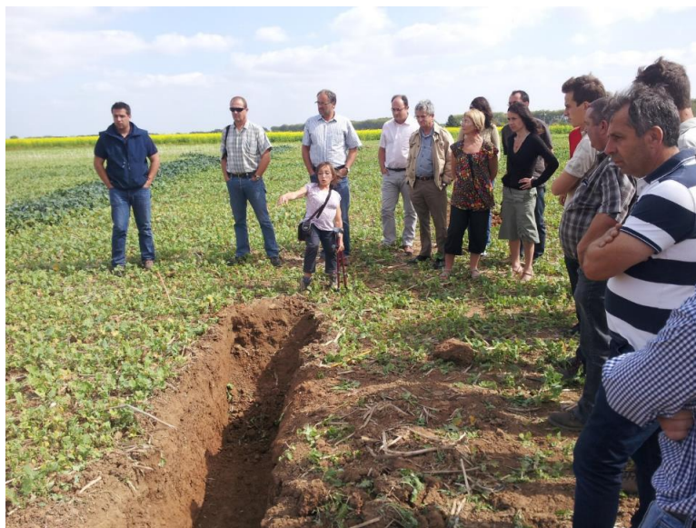
Photo 4 : Visite d'un champ du territoire lors d'une réunion du comité technique

Le champ cultivé (Photo 4 du champ avec un couvert d'interculture en septembre) est un bon moyen pour partager une culture commune autour de l'enjeu du projet, qui ne soit pas que théorique mais aussi expérientielle. Il a été à plusieurs reprises le lieu de réunions du comité technique (qui rassemble les principaux acteurs du projet). Il revient alors à l'agronome-accompagnateur de repérer les champs qui sont pédagogiques, c'est-à-dire qui contribuent à la compréhension de tous, de préparer les observations ou résultats qui pourront être partagés en séance à titre de démonstration, de questionner l'agriculteur sur son champ et ses résultats attendus lors de la réunion.