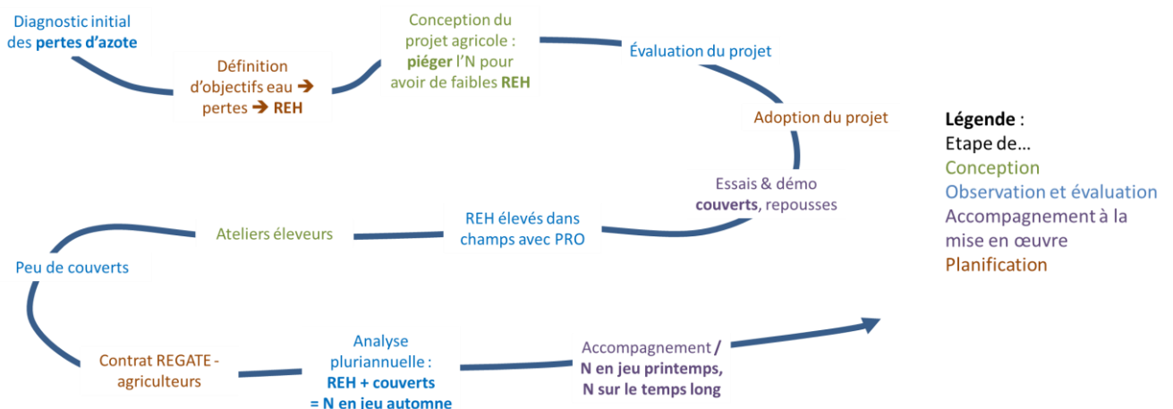
Figure 1 : Principales étapes du projet du territoire depuis 2012

Outre la dimension spatiale, l'action des agronomes-animateurs s'inscrit là dans le temps long. Comme vu plus haut, le processus de conception (Reau et Doré, 2008 ; Reau et al. , 2012 ; Meynard et al. , 2012) à l'œuvre chez chaque agriculteur pour que la transition s'opère implique des tentatives, des boucles d'ajustements, des apprentissages. Certains de ces apprentissages portent sur des phénomènes de long terme. Dans l'expérience présentée, ils portent sur les dynamiques à long terme de l'azote, et pas seulement sur les effets des pratiques des dernières semaines ou mois. Autrement dit, l'agronome-animateur est amené à travailler avec le temps rond, saisonnier, relatif à la campagne, où l'agriculteur pilote sa culture avec le climat de l'année ; et avec le temps « long », pluriannuel, qui seul permet de dégager avec recul les dynamiques de long terme de l'azote et de l'eau. Ce temps long pose néanmoins la difficulté de garder l'intérêt et la motivation des agriculteurs. Il pose aussi des questions méthodologiques, pour garder la mémoire des apprentissages, des étapes de la transition ou encore des résultats des champs du territoire.