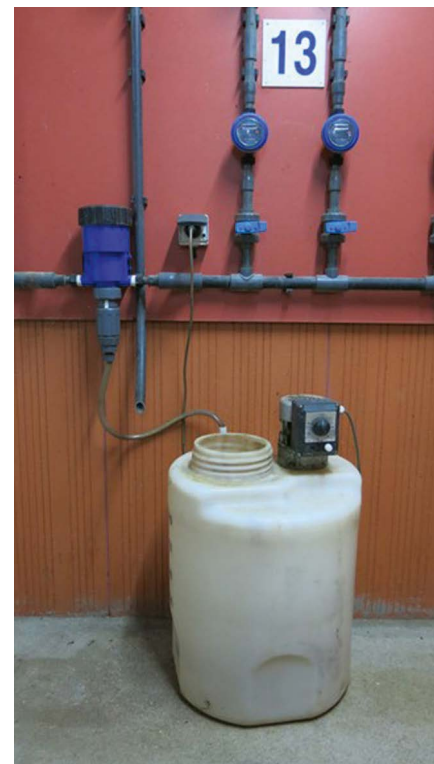
Figure 3. Installation de pompe doseuse permettant la distribution d'antibiotiques dans l'eau de boisson. Plus souple et réactive que l'administration dans l'aliment, l'administration d'antibiotiques dans l'eau de boisson grâce à la pompe doseuse a permis de réduire l'usage d'antibiotiques dans les filières monogastriques.

par exemple l'approche Alterbiotique 6 , avec un développement notable de la phytothérapie.