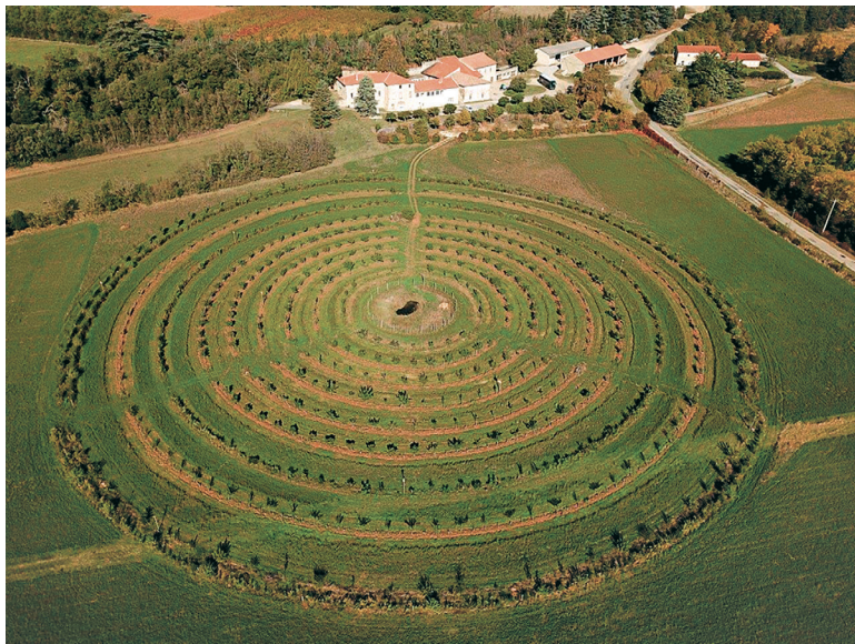
Photo 1 – Verger circulaire implanté à INRAE Gotheron, premier module fruitier du projet « Z ».

À Gotheron, une phase de conception supra-parcellaire pour aménager la zone d'une dizaine d'hectares a été initiée dans le cadre du projet Be-Creative (PPR 8 « Protéger et cultiver autrement », 2021-2026).