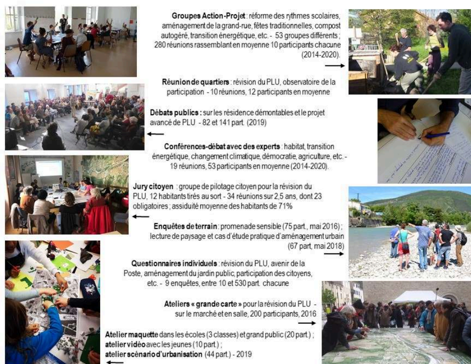
Figure 4. Quelques exemples illustrés de pratiques participatives