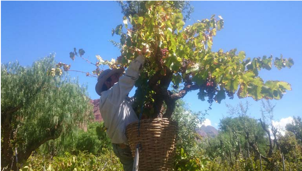
Figura 3. Vendimia en sistemas de uvas tradicionales.