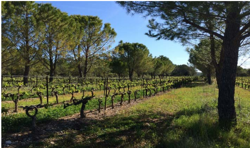
Figura 4. Evaluación de prácticas agroforestales en viñedos modernos. INRAE Montpellier (Francia).

árboles nativos para apoyar el parral fue una adaptación al medioambiente de ese entonces y representa el genio de los que supieron utilizar los recursos andinos para apoyar una agricultura de origen europeo (Oliva et al. , 2022a).