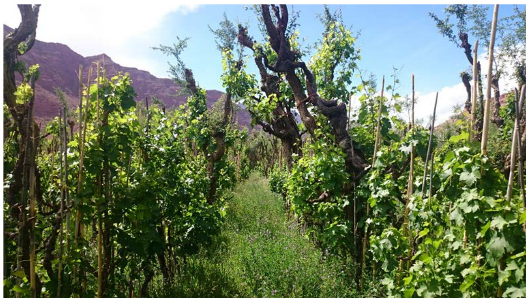
Figura 2. Sistema de uva tradicional en el Valle de los Cintis.

Los orígenes de esta viticultura están estrechamente relacionados con la explotación minera de Potosí, durante el periodo colonial (Pszczolkowski & Villena, 2009; Vicente & Contreras, 2012; Aillón Soria & Kirigin, 2013; Káiser, 2016; Castro San Carlos et al. , 2022). Potosí durante el siglo XVI y XVII era la ciudad más poblada del hemisferio occidental (Aillón Soria & Kirigin, 2013). En 1650 la ciudad de Potosí contaba con más de 160.000 habitantes, diez veces más que Boston y rivalizando con Amberes, Londres, Sevilla o Venecia, esto debido a la gran explotación minera de ese entonces (Castro San Carlos et al. , 2022). La gran población que habitaba Potosí consumía grandes cantidades de alcohol, principalmente para poder soportar el clima extremo de la región ubicada a