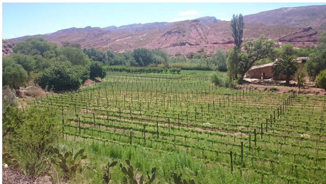
Figura 5. Sistemas vitícola moderno introducido en el Valle de los Cintis. (Fuente: Fotografía propia, Pablo Oliva Oller).