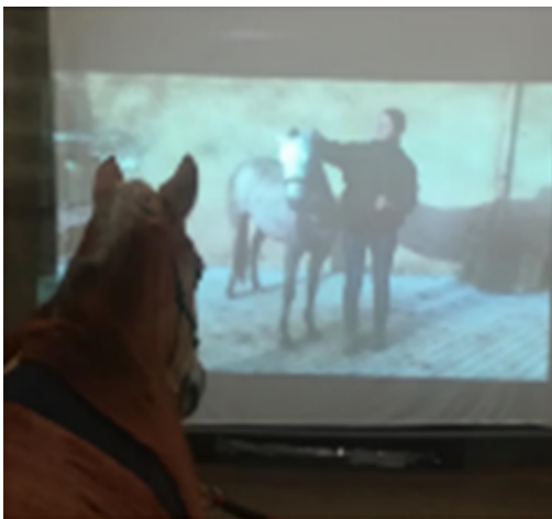
Image 1 : Photographie d'une jument regardant une vidéo d'une interaction positive entre un humain et un autre cheval (Trösch et al. , 2020)

Dans cette étude, vingt-trois chevaux ont été testés. On leur a montré deux vidéos, projetées sur un écran en taille réelle et sans le son (voir images 1 et 2).