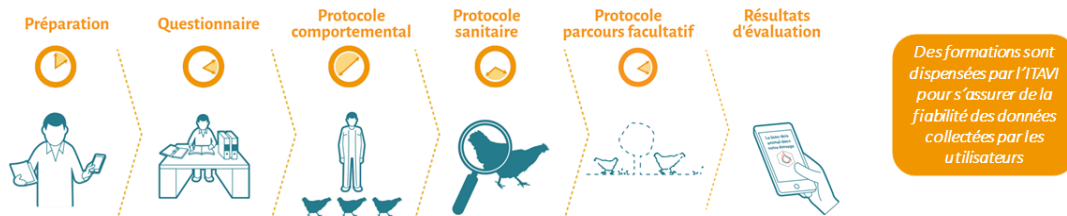
Figure 1 : Etapes de la mise en œuvre de la méthode EBENE®

L'éleveur, le technicien ou le vétérinaire peuvent également avoir le détail du score obtenu pour chaque indicateur. De la même façon, un onglet « conseils » permet de directement visualiser, grâce à un code couleur, les critères à améliorer pour favoriser le bien-être des animaux. Chaque évaluation est conservée dans l'historique du compte de l'utilisateur, ce qui lui permet de comparer ses différentes évaluations et observer les potentielles évolutions. Si l'utilisateur est rattaché à un groupement disposant d'une licence EBENE®, l'application offre alors la possibilité de comparer ses résultats aux autres éleveurs du même groupement (scores moyennés).