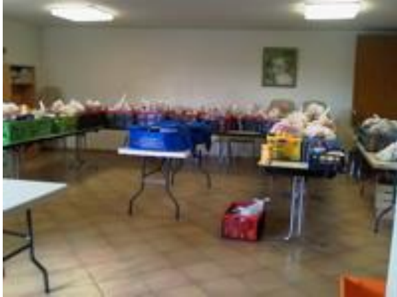
Distribution de colis déjà préparés