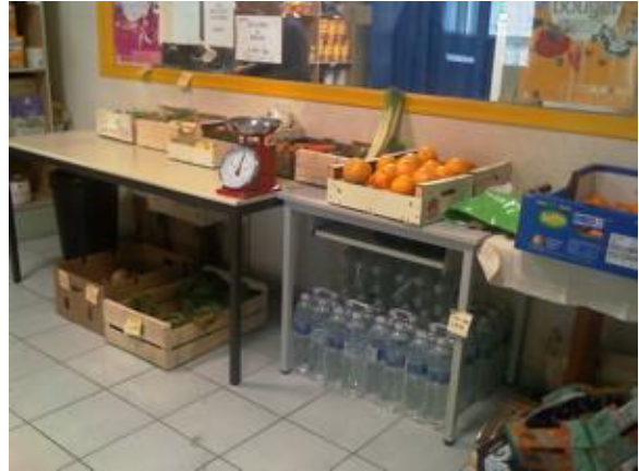
Rayonnages d'une épicerie sociale