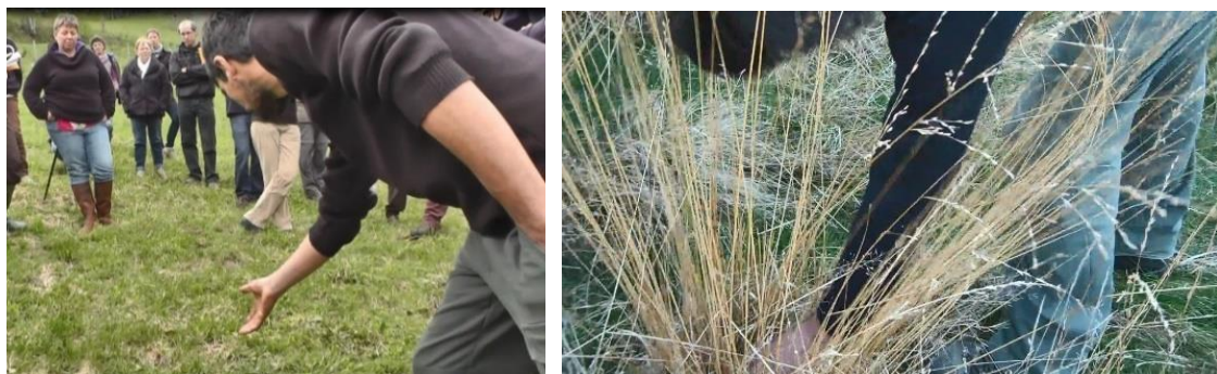
Figure 1. Désigner l'objet à observer dans un environnement complexe

Les rencontres du réseau Pâtur'Ajuste ont lieu sur la ferme d'un participant et comprennent une visite de parcelles qui permet de rendre visibles les objets de l'activité. Lors de cette visite, les éleveurs désignent fréquemment là où doit porter le regard par des gestes (montrer, prendre, cf. Figure 1), permettant de désigner ce qui compte dans l'activité (ici une espèce végétale).