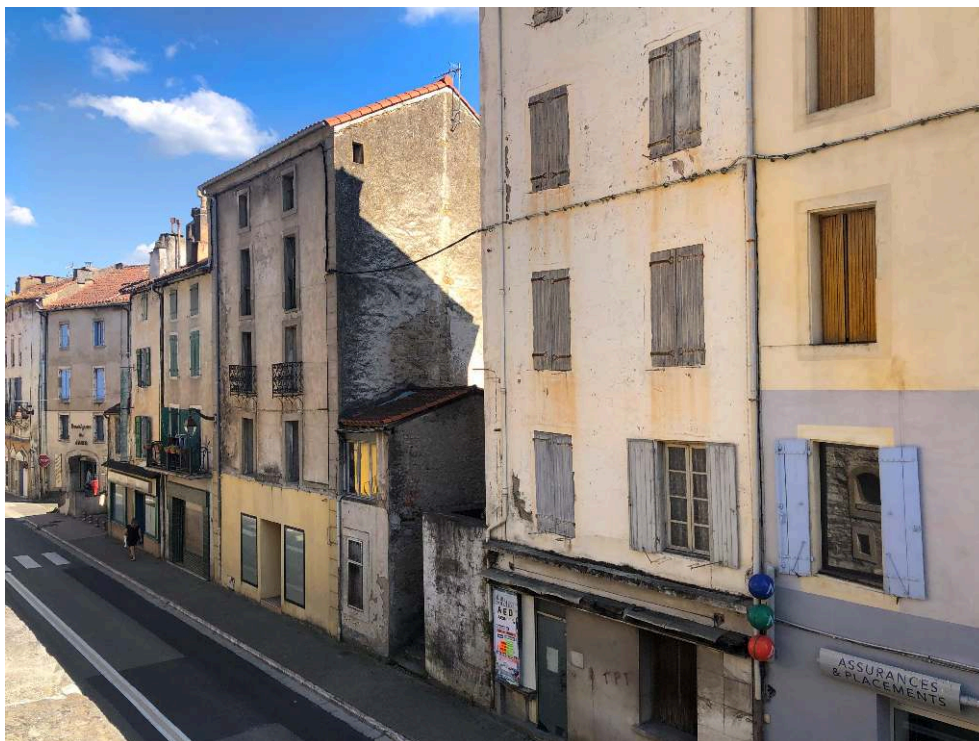
Photo 1 : La Grand Rue, principal axe commercial de Saint-Pons-de-Thomières