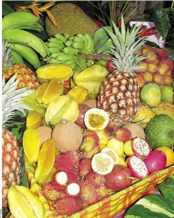
Une grande diversité de fruits tropicaux cultivés ou non cultivés contient des molécules d'intérêt telles que les polyphénols.

Mais cette mise au point ne peut pas faire l'objet d'un brevet car elle est utilisée depuis des siècles dans d'autres pays pour d'autres cultures. J'ai simplement appliqué ce qui était connu par ailleurs. N'ayant pas cette culture de la conserve aux Antilles, nous ne consommons pas de conserves. L'innovation était au niveau du gombo, fruit que l'on consomme cuit. Cuit, c'est un produit gluant. Quand j'ai fabriqué cette