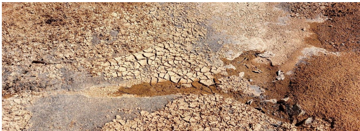
Photo 2 : Dépôt de boues sur les rochers aux abattis Cottica-Maroni