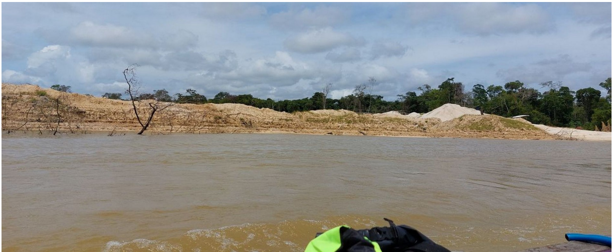
Photo 1 : Berges orpaillées au Suriname