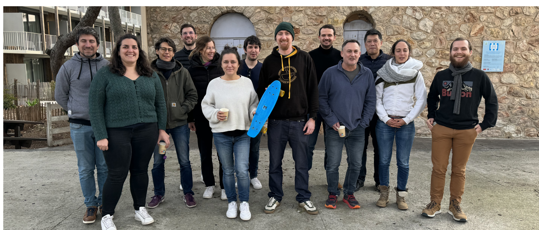
Hackaton SK8 2024 @ Sète