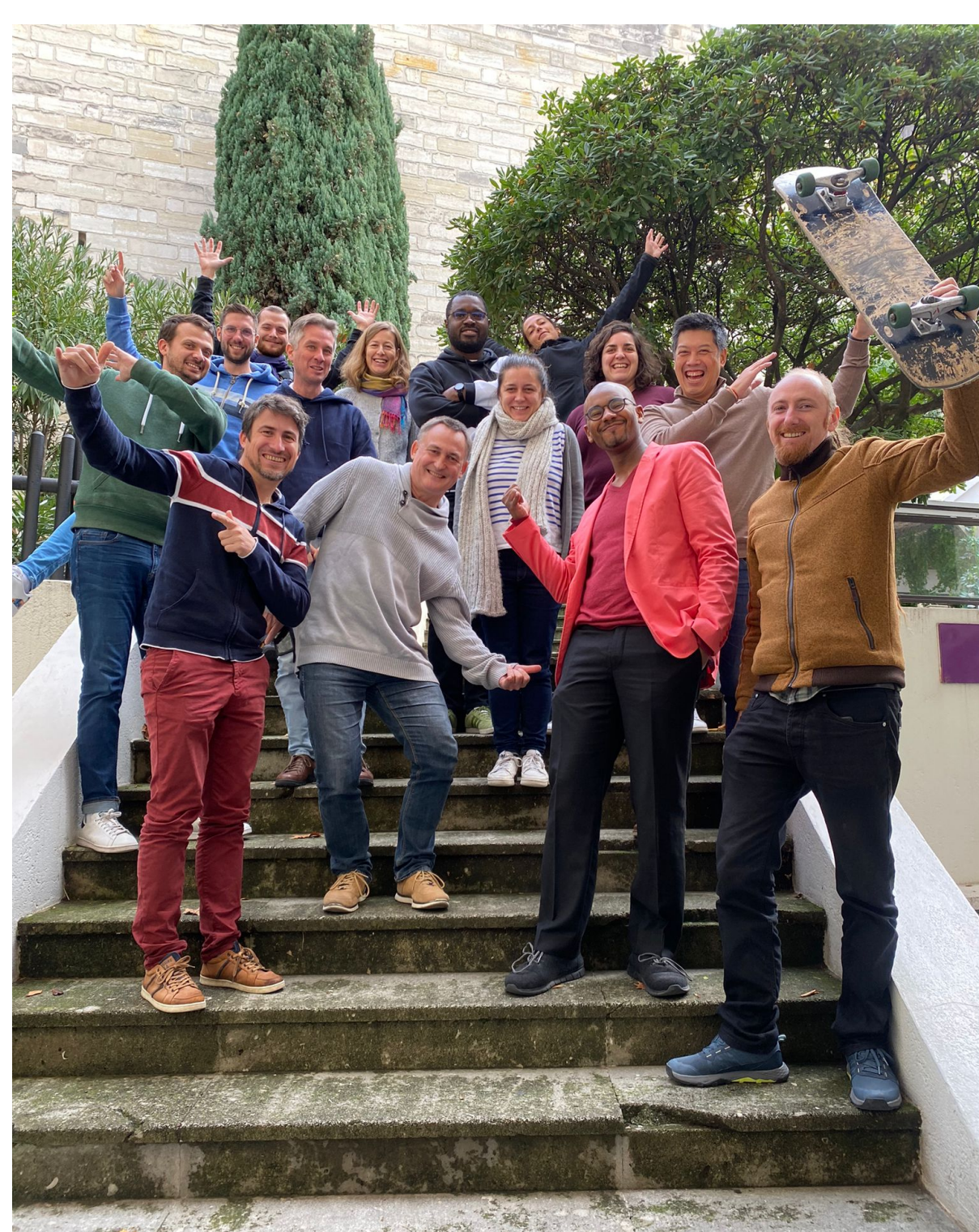
Hackaton SK8 2022 @ Avignon