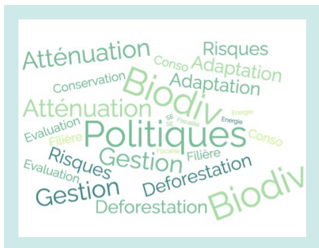
Figure 1 : Nuage de mots des thématiques du département en lien avec la forêt.

Les mots clés que nous ont communiqués les répondants décrivent une forte variété de thématiques et d'enjeux. Le positionnement du département sur les politiques publiques (incluant les mots clés conservation et fiscalité) se traduit dans les réponses (20 % au total). Parmi les autres thématiques, on note une répartition assez équilibrée : 13 mots clés ayant chacun reçu entre 5 et 8 % des réponses exprimées. Un tiers (31 %) de ces mots clés porte sur les questions en lien avec le climat et la biodiversité (adaptation, atténuation, biodiversité, déforestation). Ensuite, un autre ensemble de mots clés (26 %) est relatif à la gestion forestière, aux services écosystémiques et aux risques associés. Enfin, les questions d'économie de filière, en particulier liées à la bioéconomie et à l'énergie, représentent 18 % de ces autres thématiques.