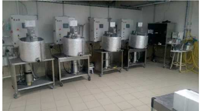
Photo 1 : Minifromagerie expérimentale de l'URTAL ( https://minifromagerie-poligny.hub.inrae.fr )

Deux technologies fromagères ont été testées en parallèle sur les laits dits « de mélange » : une pâte pressée cuite (technologie Gruyère gras) et une pâte pressée non cuite (technologie Tomme à croûte lavée). Chacune de ces technologies a fait l'objet d'une transformation avec et sans ajout d'un levain lactique réducteur. L'hypothèse testée est que l'utilisation de ce levain technologique « Redox » permet d'apporter de la robustesse à la transformation fromagère, tout en préservant les qualités originelles du lait (la transformation se faisant en lait cru). Des analyses de qualité des laits individuels et de mélange (microbiologie, physicochimie) ont été réalisées et la qualité des fromages a été évaluée d'un point de vue microbiologique, physicochimique, rhéologique et organoleptique.