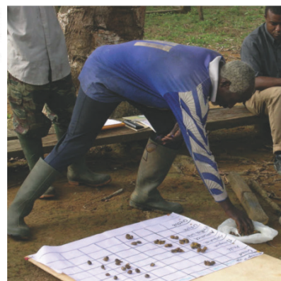
Figure 1 : Exemple d'une évaluation réalisée à partir des dires d'agriculteurs concernant les usages des espèces au sein d'un système de culture cacaoyer au Cameroun (tiré de la thèse de P. Jagoret 24 )