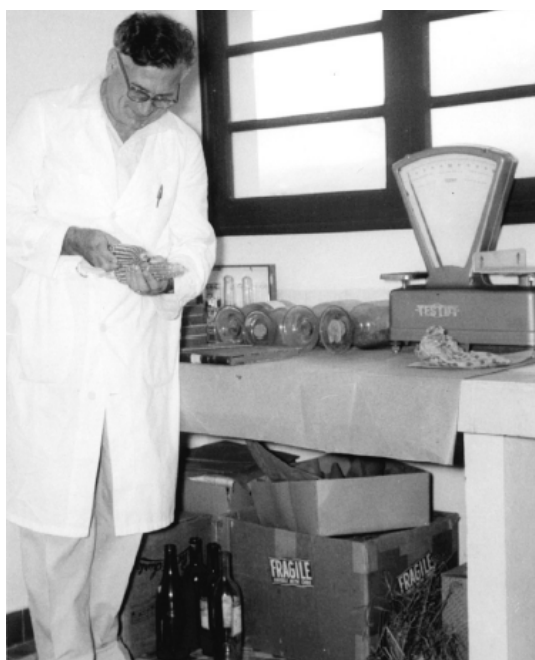
Améliorateur des plantes

Pendant les quinze ans que Stehlé a été directeur du centre INRA Antilles-Guyane, il a visité la presque totalité de la Caraïbe et de l'Amérique Centrale et du Sud. Il a participé à de nombreux congrès et colloques, et réalisé plusieurs missions d'ex-