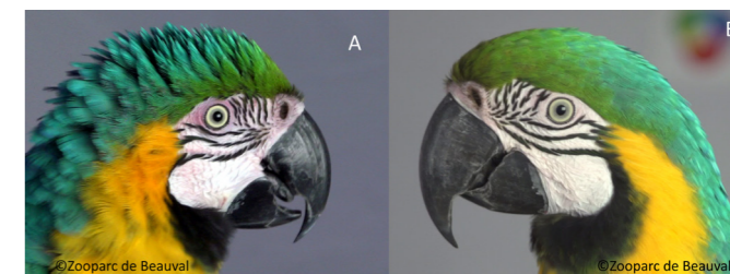
A) un ara avec les plumes de la calotte (dessus de la tête) et de la nuque dressées et la peau des joues rougie ; B) un ara avec les plumes de la calotte et de la nuque lisses et la peau des joues blanche.

L'ensemble de l'expérience a été filmé et une image a été extraite toutes les 5 secondes pour chaque caille. Avec un logiciel d'analyse d'images, les scientifiques ont mesuré trois paramètres sur les images : la hauteur des plumes de la calotte, l'angle formé par les plumes de la gorge et la surface de la pupille. L'hypothèse des scientifiques était que s'il existait des indicateurs faciaux d'émotions positives, de plus amples variations dans ces paramètres devraient être observées chez les cailles les moins peureuses (i.e. plus à même d'évaluer positivement leur environnement) que chez les cailles les plus peureuses (i.e. plus à même d'évaluer négativement leur environnement). Les scientifiques ont ainsi pu montrer un dressement des plumes de la calotte et une