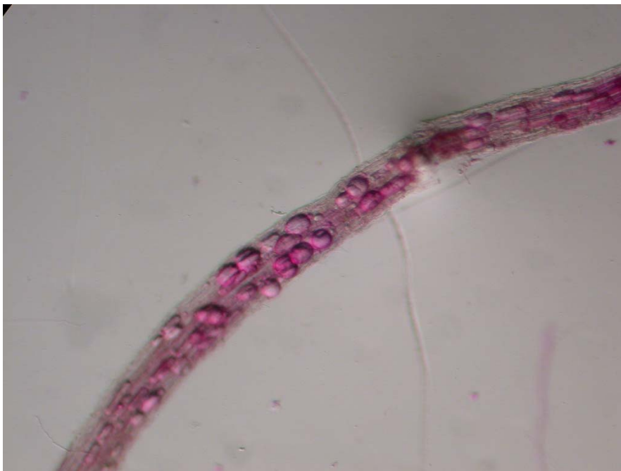
Figure 2 : Vésicules intracellulaires sur racine de maïs (X60X2 en numérique), après coloration des racines