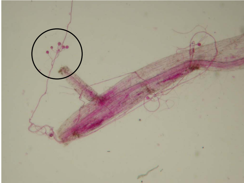
Figure 1 : Vésicules extracellulaires avec mycélium sur racines de maïs (grossissement X60), après coloration des racines.