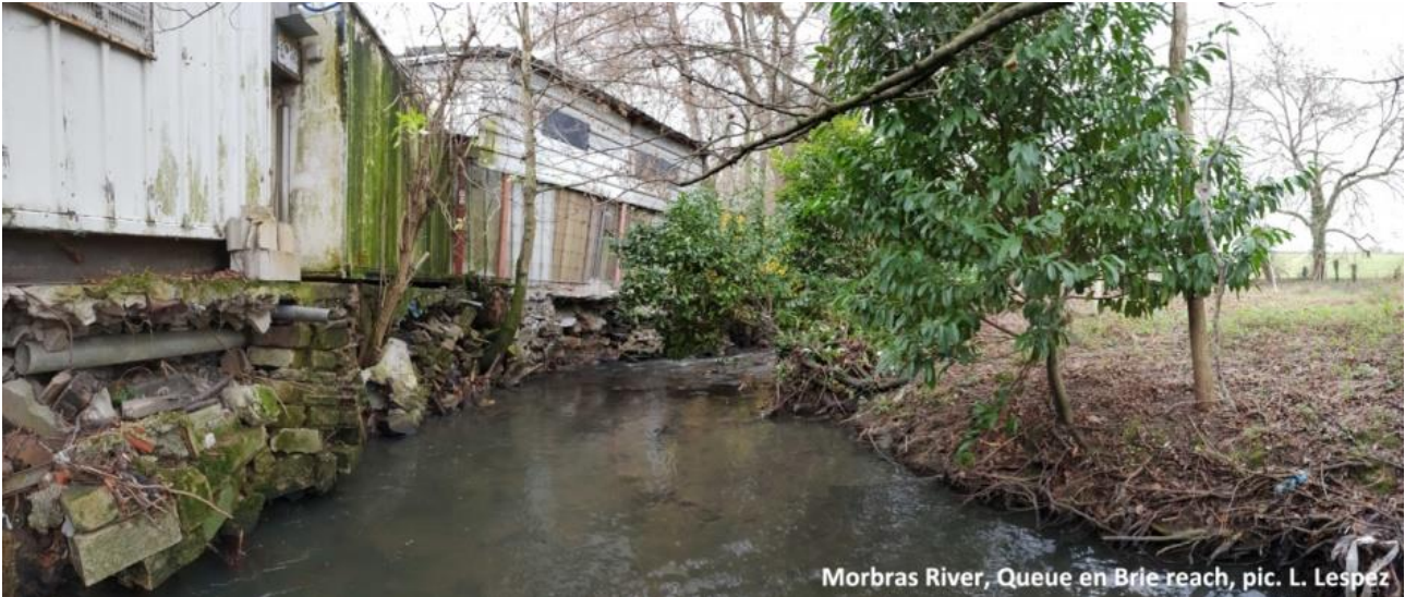
Figure 1. Rivière du Morbras : exemple de petits cours d'eau nécessitant une approche hybride. L'érosion des berges et la végétation riveraine résultent d'interactions complexes entre des processus hybrides et des héritages millénaires à décennaux (sédiments de la plaine d'inondation, différentes générations de constructions en berge, végétation spontanée et introduite, pratiques des riverains et des gestionnaires).