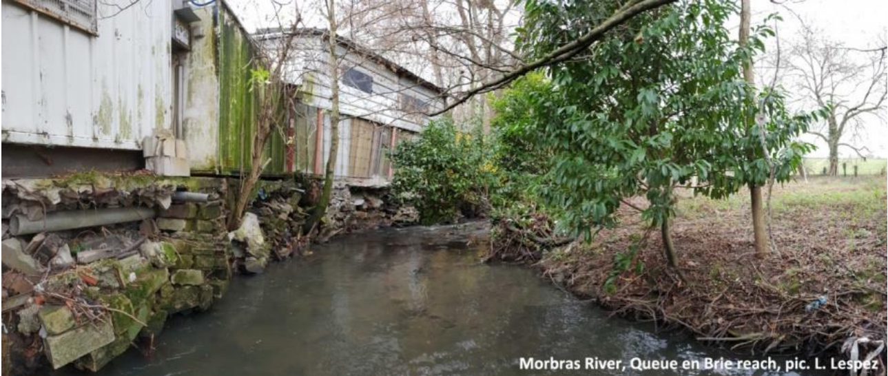
Figure 1. Rivière du Morbras : exemple de petits cours d'eau nécessitant une approche hybride. L'érosion des berges et la végétation riveraine résultent d'interactions complexes entre des processus hybrides et des héritages millénaires à décennaux (sédiments de la plaine d'inondation, différentes générations de constructions en berge, végétation spontanée et introduite, pratiques des riverains et des gestionnaires).