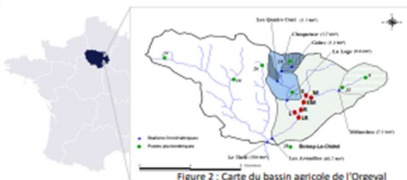
Figure 2 : Carte du bassin agricole de l'Orgeval