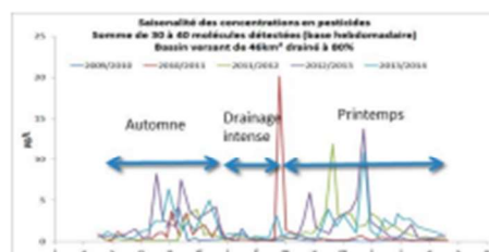
Figure 1 : Graphique de la saisonnalité des pesticides sur le bassin versant de l'Orgeval

en automne contrairement aux fongicides qui sont retrouvés à de fortes concentrations au printemps. Les pesticides altèrent la qualité des eaux douces et menacent la biodiversité associée (2). Il est donc pertinent de réaliser un diagnostic précoce de l'état de santé des populations sauvages afin de les préserver. L'utilisation d'une approche par des biomarqueurs multiniveaux (populationnels, individuels et cellulaires) permettent d'évaluer des réponses biologiques à ces pressions chimiques (3). In situ , de nombreux paramètres abiotiques et biotiques impactent les populations sauvages. Cependant, il existe un manque de connaissances entre exposition et impact en conditions réelles (ESCO, 2022).