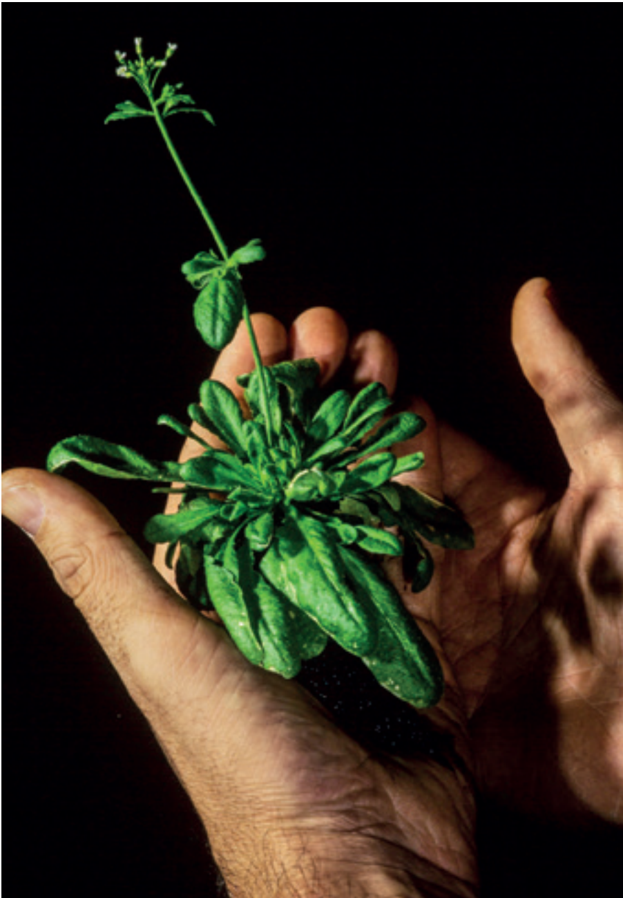
Plantules Arabidopsis Thaliana , Inra Versailles.

Georges Pelletier, lui aussi arrivé au laboratoire pour poursuivre ses travaux sur la stérilité mâle cytoplasmique (CMS Ogura), a proposé d'utiliser un homozygote Rac pour le croiser avec un tabac normal donneur de